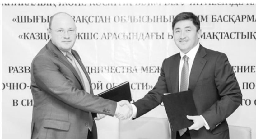
Подписание договора между «Казцинком» и Управлением образования

Учебные заведения Восточно-Казахстанской области и ТОО «Казцинк» договорились совместно готовить кадры в системе профтехобразования.